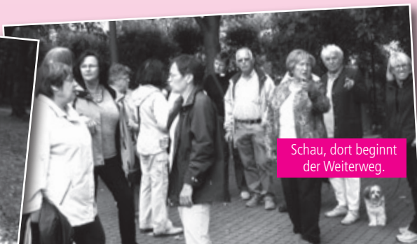
Schau, dort beginnt der Weiterweg.