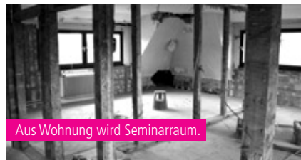
Aus Wohnung wird Seminarraum.