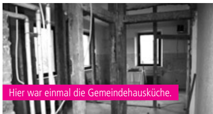
Hier war einmal die Gemeindehausküche.